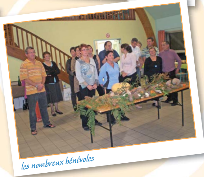
les nombreux bénévoles