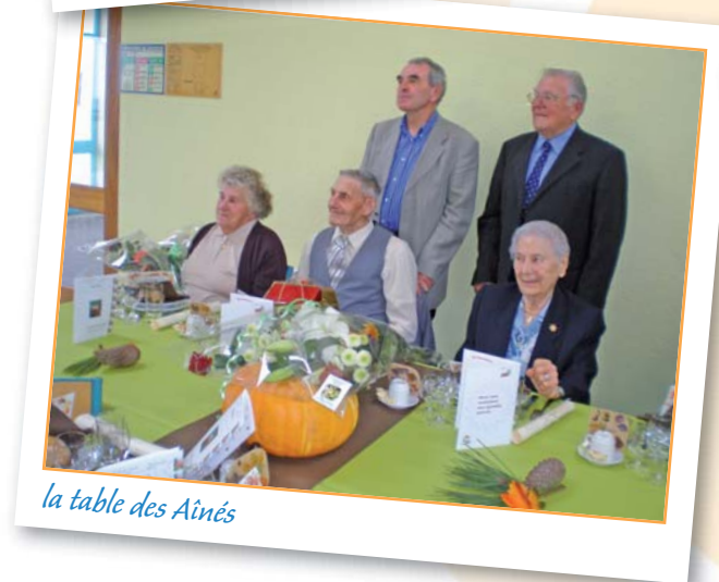
la table des Aînés