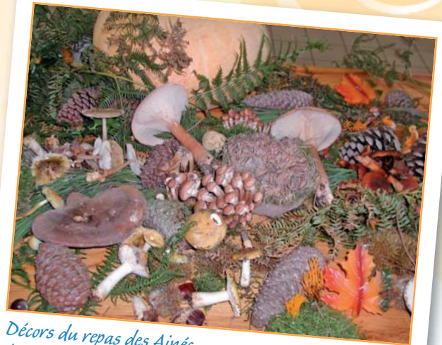
Décor du repas des Aînés (sur le thème des champignons)