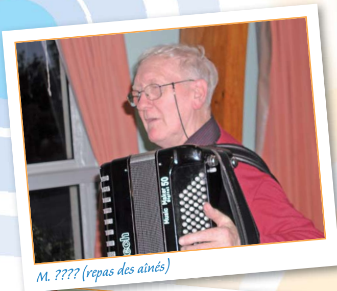
M. ??? (repas des aînés)