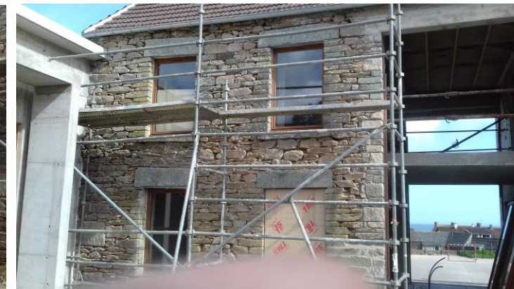
La façade de la Maison Médicale, côté Infirmières