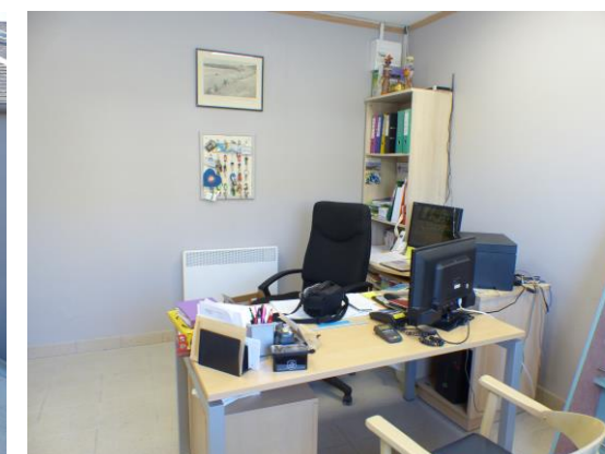
Photos illustrant le travail réalisé par nos Services Techniques au camping