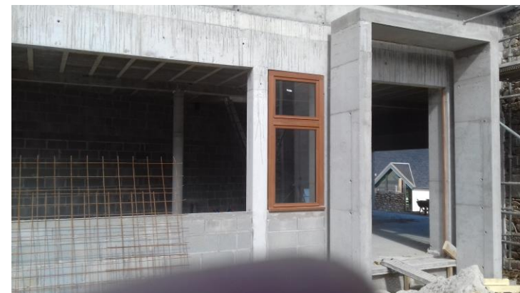
La future entrée de la bibliothèque

Les travaux de la Maison Médicale et de la Bibliothèque se poursuivent malgré quelques difficultés climatiques et de disponibilité de certaines entreprises. Si le calendrier est toujours tenu pour la première (qui est une priorité absolue), il sera difficile que la seconde soit achevée avant les congés du mois d'août.