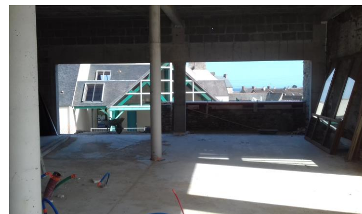
Intérieur de la Bibliothèque