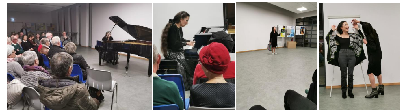
Soirée Piano et Danse contemporaine