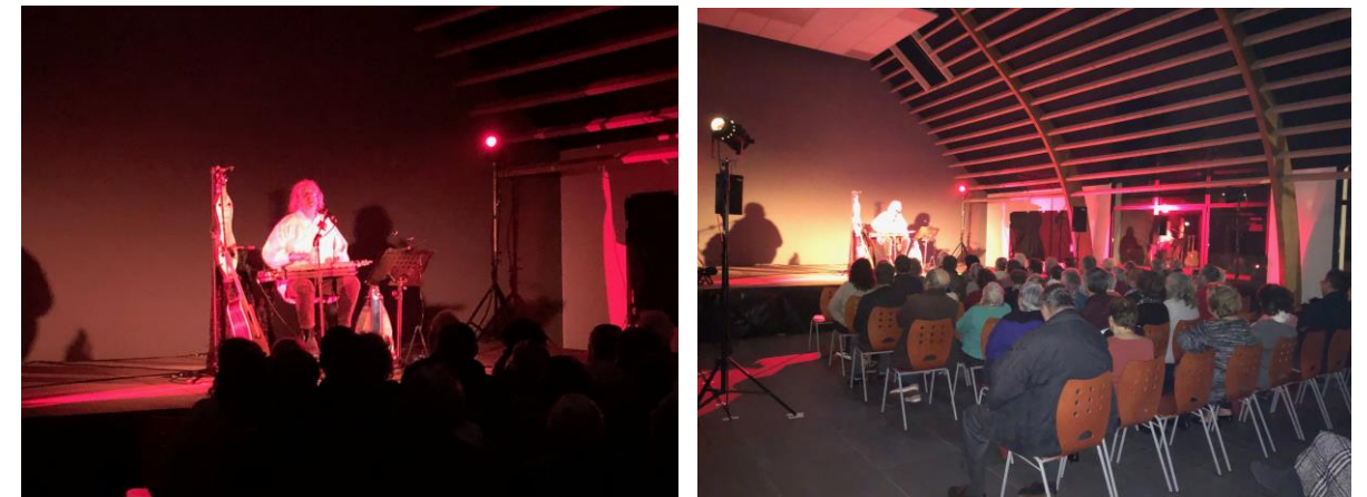
Soirée avec un Chanteur de Sornettes