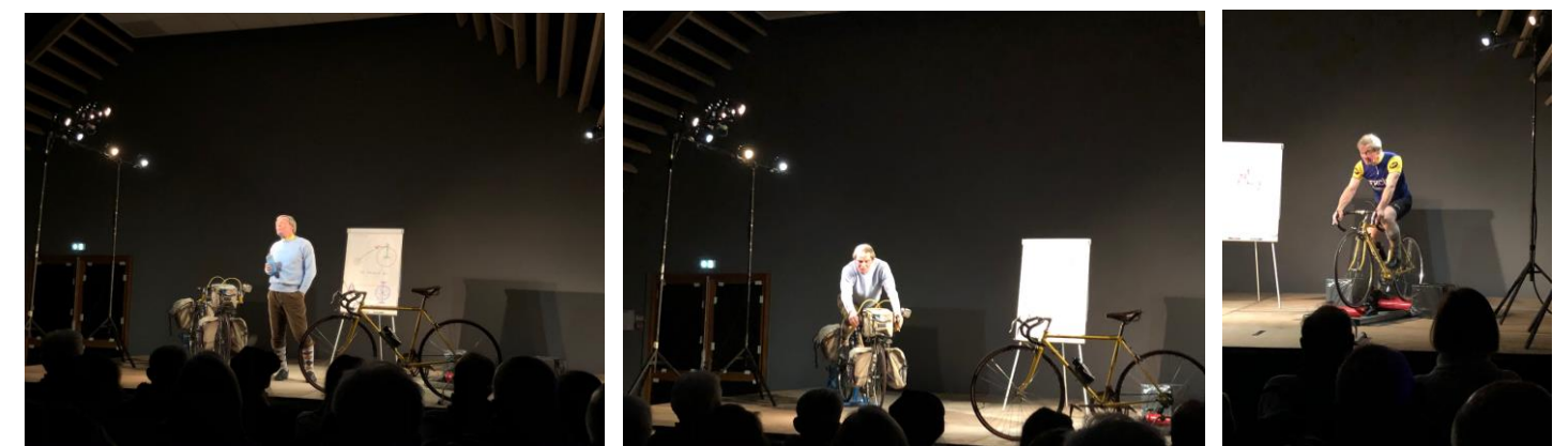
Soirée Éloge du Ventoux