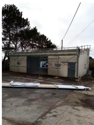
Désamiantage et couverture : travaux réalisés par entreprises