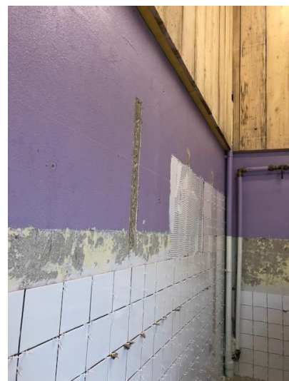
Réhabilitation des sanitaires du camping municipal (travaux en cours, réalisés par les agents du service technique)