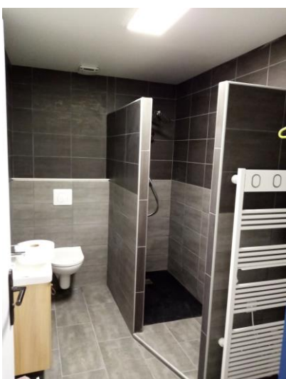
Travaux réalisés par les agents du service technique : Vestiaire pour personnel féminin