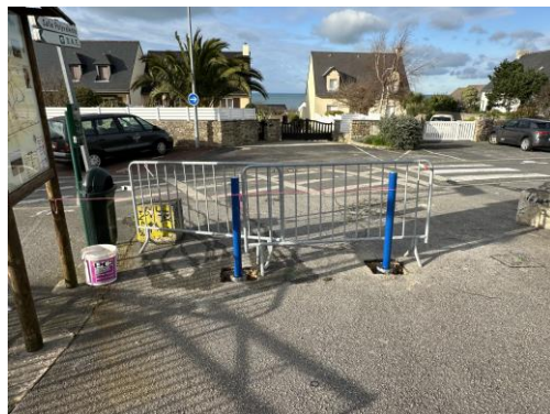
↑ Pose de potelets Sécurité du groupe scolaire