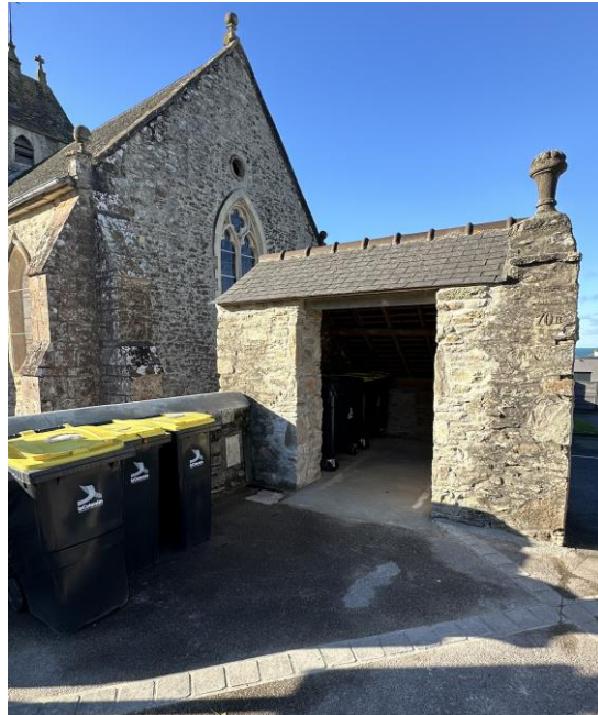
← Local poubelles pour salle de la Chênevière