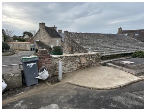
← Ancien cimetière Mur de protection pour éviter les chutes de personnes