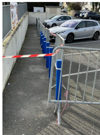
↑ Pose de potelets Sécurité des piétons