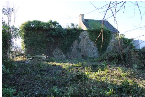
← Nettoyage d'un bien communal, Hameau Liot